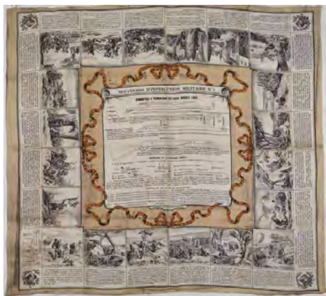
Mouchoir d'instruction du fusil français (Lebel)