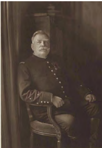
Joseph Joffre photographie.