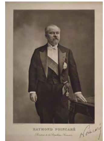
Portrait officiel de Raymond Poincaré, Président de la République française. (héliogravure d'après une photographie d'E. Pirou) BnF, dpt. des Estampes et de la photographie