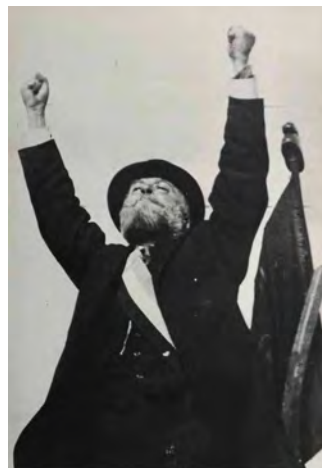
Jean Jaurès en meeting, vers 1910.