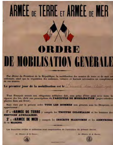
Armée de Terre et Armée de Mer : Ordre de mobilisation générale, 2 août 1914, affiche. BnF, dpt des Estampes et de la photographie