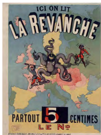
Ici on lit la Revanche . Affiche, E. Lévy, 1886 BnF, dpt. des Estampes et de la photographie