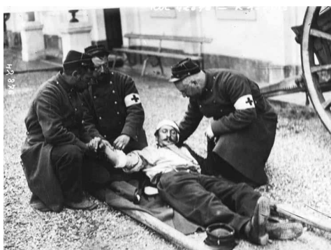
Brancardiers portant secours à un blessé français, 1914