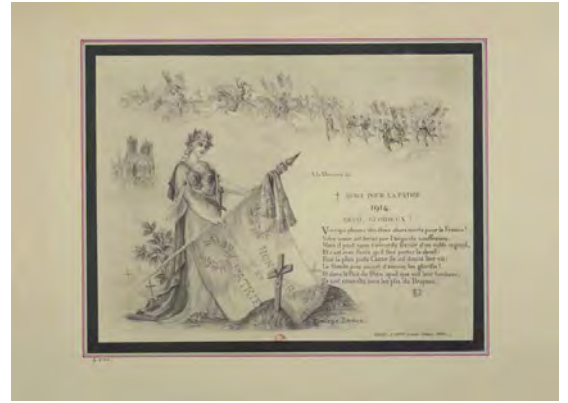
E. Lemielle-Drieux, À la mémoire de ... Mort pour la patrie , 1914.