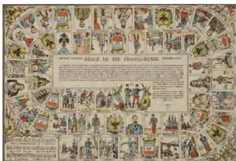
Règle du jeu franco-russe Imagerie Marcel Vagné, Pont-à-Mousson, [avant 1894] Paris, Musée national de la Marine