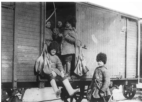
Cosaques partant à la frontière [soldats dans un wagon], 1914