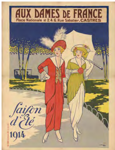
Aux Dames de France, saison d'été, 1914. Affiche BnF, dpt. des Estampes et de la photographie

Iconographie disponible dans le cadre de la promotion de l'exposition et pendant la durée de celle-ci. Les images ne peuvent faire l'objet d'aucune retouche ni d'aucun recadrage.