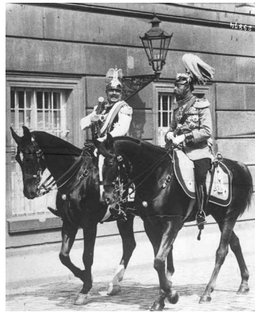
Le Kaiser Guillaume II à Postdam. et le roi George V d'Angleterre