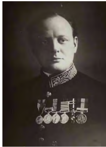
Winston Churchill vers 1910, photographie. BnF, dpt. des Estampes et de la photographie