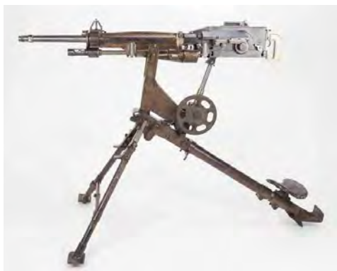
Mitrailleuse Saint-Etienne modèle 1907 (avec affût)