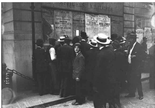
2 août 1914, mobilisation : la foule lisant les affiches. Photographie de presse, agence Rol BnF, dpt. des Estampes et de la photographie