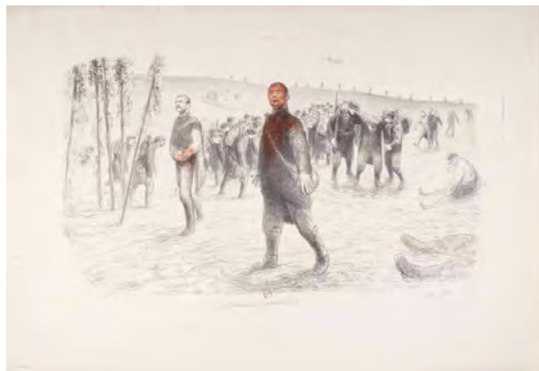
En Lorraine, septembre 1914. Lithographie de Jean Veber. BnF, dpt. des Estampes et de la photographie