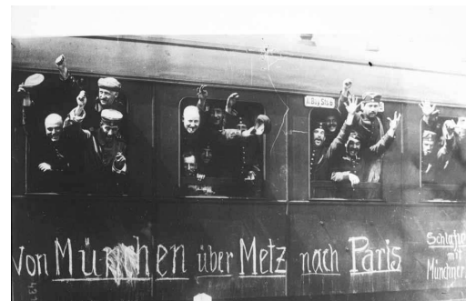
Soldats allemands quittant Munich [en train, pour aller à Paris], 1914