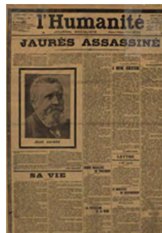
L'Humanité , journal du 1 er août 1914.