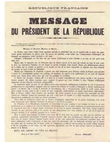
Message du Président de la République. Affiche du discours de l'Union sacrée, 4 août 1914 BnF, dpt. des Estampes et de la photographie