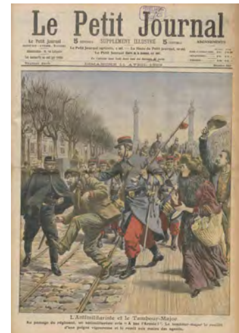
L'antimilitariste et le tambour major, supplément illustré du Petit journal, 11 avril 1909 Conservatoire de Musique Militaire de l'Armée de Terre, Satory