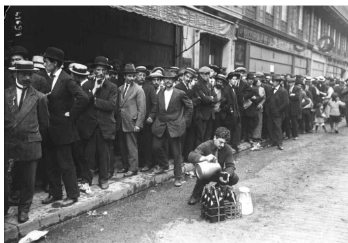
Inscription des étrangers avant leur évacuation, pour certains, en Bretagne Paris, 5 août 1914