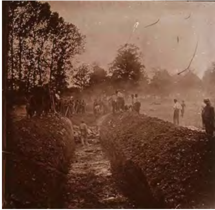
Bataille de la Marne, 1914, fosse commune Vincennes, Service historique de la Défense