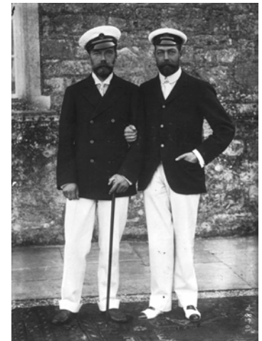
Le tsar Nicolas II et le roi George V d'Angleterre