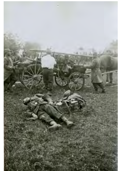
Ramassage des cadavres par les soldats des régiments territoriaux après la bataille de la Marne, septembre 1914 Vincennes, Service historique de la Défense