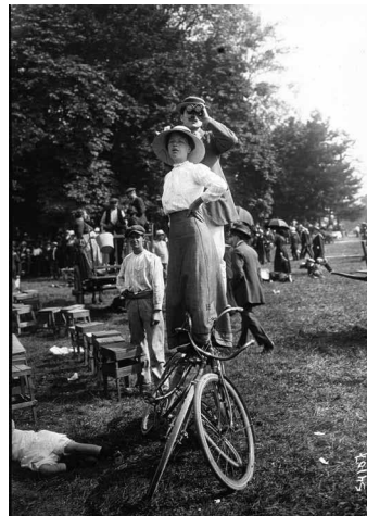
La revue du 14 juillet : en équilibre sur deux bicyclettes.