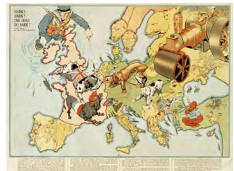
Hark ! Hark ! The dogs do bark ! Londres, Johnson, Riddle and Co, 1914, lithographie, affiche BnF, dpt. des Estampes et de la photographie