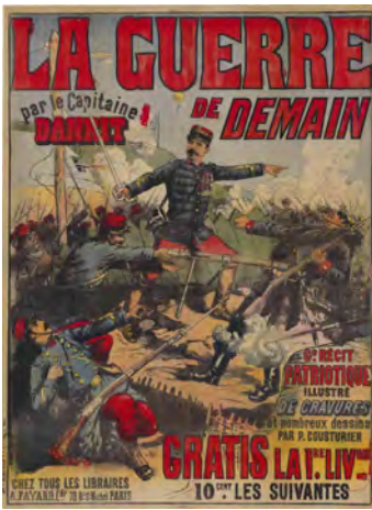
La Guerre de demain par le capitaine Danrit, g[ran]d récit patriotique [...] Affiche BnF, dpt. des Estampes et de la photographie