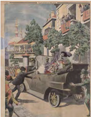
« Assassinat de l'archiduc héritier d'Autriche et de la duchesse sa femme à Sarajevo » Le Petit journal , supplément illustré, journal du 12 juillet 1914. BnF, dpt. Philosophie, histoire, sciences de l'homme