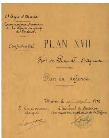
6 e Corps de l'Armée. Commandement supérieur de la défense du groupe de Verdun, Plan XVII. Fort de Liouville - Saint-Agnant Plan de défense, Verdun, 15 avril 1914 Vincennes, Service historique de la Défense