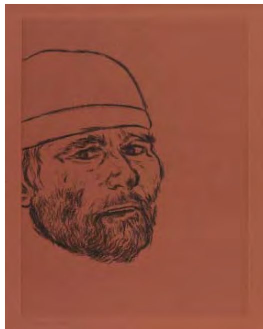
7- R.B. Kitaj, Self-portrait (After Matteo) , 1983 Vernis mou BnF, dépt. des Estampes et de la photographie © R.B. Kitaj