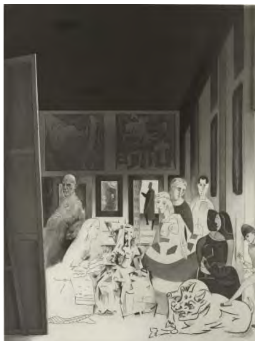
2- Richard Hamilton, Picasso's meninas , 1973 Eau-forte, aquatinte, roulette, brunissoir BnF, dépt. des Estampes et de la photographie © R. Hamilton. All Rights Reserved, ADAGP Paris 2014