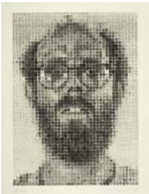
6- Chuck Close, Self Portrait , 1988 Eau-forte et aquatinte BnF, dépt. des Estampes et de la photographie © Chuck Close