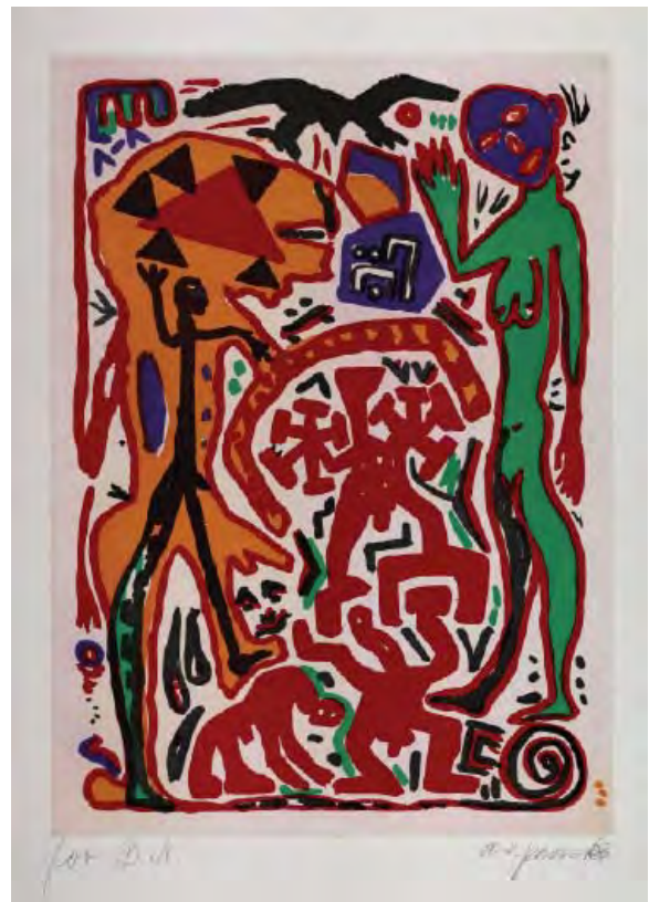
5- A.R. Penck (Ralph Winkler), Aus der Kindlichen in die pubertäre phase , 1984 Aquatinte en couleurs BnF, dépt. des Estampes et de la photographie © A.R. Penck/ ADAGP Paris 2014