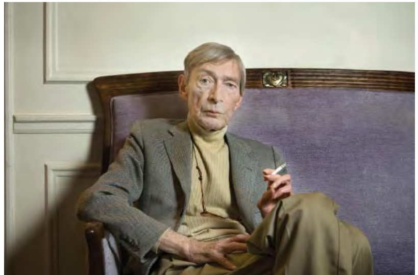
19- Portrait d'Aldo Crommelynck, 2007 BnF, dépt. des Estampes et de la photographie