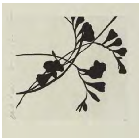
14- Donald Sultan, Black Freesia 5 , 1988 Aquatinte BnF, dépt. des Estampes et de la photographie © Donald Sultan / ADAGP Paris 2014