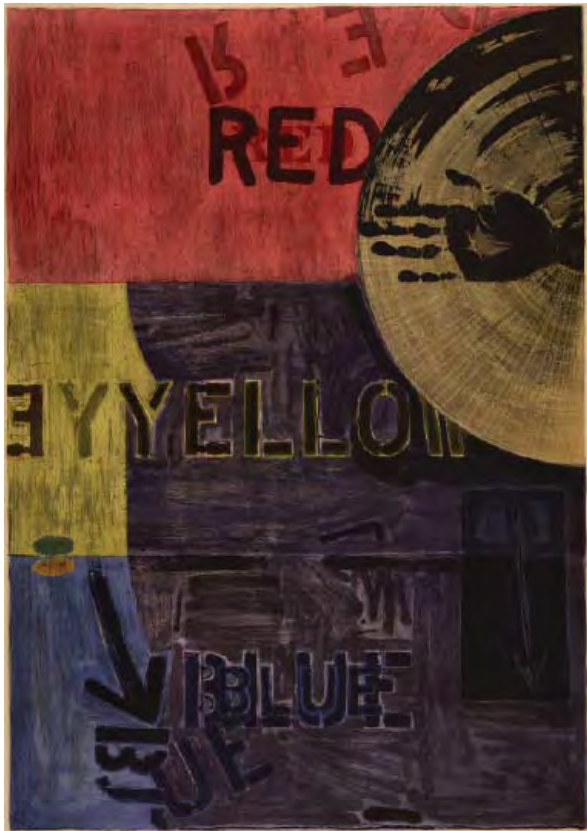
4- Jasper Johns, Periscope (Ulae 218) , 1981 Eau-forte et aquatinte en couleurs BnF, dépt. des Estampes et de la photographie © Jasper Johns/ ADAGP Paris 2014