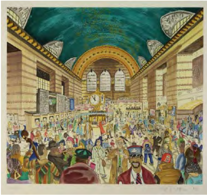
8- Red Grooms, Grand Central Terminal 1 , 1994 Eau-forte, vernis mou et aquatinte en couleurs BnF, dépt. des Estampes et de la photographie © Red Grooms/ ADAGP Paris 2014