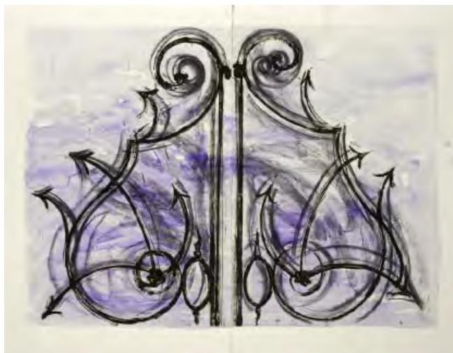
3- Jim Dine, Blue detail from the Crommelynck gate , 1982 Eau-forte, aquatinte, instruments électriques BnF, dépt. des Estampes et de la photographie © Jim Dine / ADAGP Paris 2014