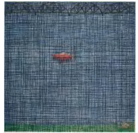
12- Jennifer Bartlett, Bridge, boat, dog , 1997 Eau-forte en couleurs BnF, dépt. des Estampes et de la photographie © Jennifer Bartlett