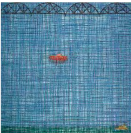
10- Jennifer Bartlett, Bridge, boat, dog , 1997 Eau-forte en couleurs BnF, dépt. des Estampes et de la photographie © Jennifer Bartlett