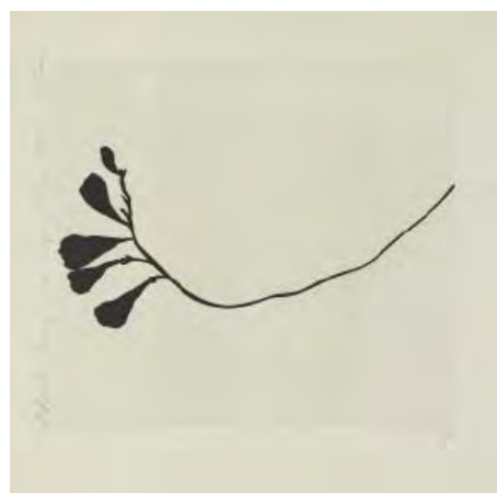
15- Donald Sultan, Black Freesia 6 , 1988 Aquatinte BnF, dépt. des Estampes et de la photographie © Donald Sultan / ADAGP Paris 2014