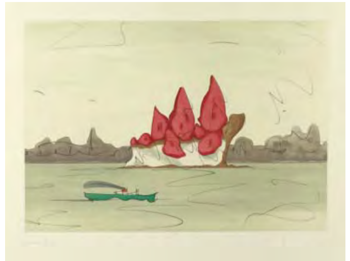
9- Claes Oldenburg, Proposed monument for Mill Rock, East River, NYC : slice of strawberry cheesecake , 1992 Aquatinte BnF, dépt. des Estampes et de la photographie © Claes Oldenburg