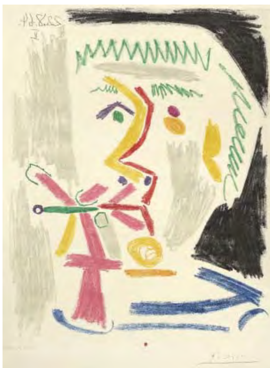
1- Pablo Picasso, Fumeur à la cigarette verte , 1970 Eau-forte, pointe sèche, grattoir, aquatinte BnF, dépt. des Estampes et de la photographie © Succession Picasso 2014

Pour le visuel ©Succession Picasso 2014, utilisation pour 1/4 de page uniquement et hors couverture.