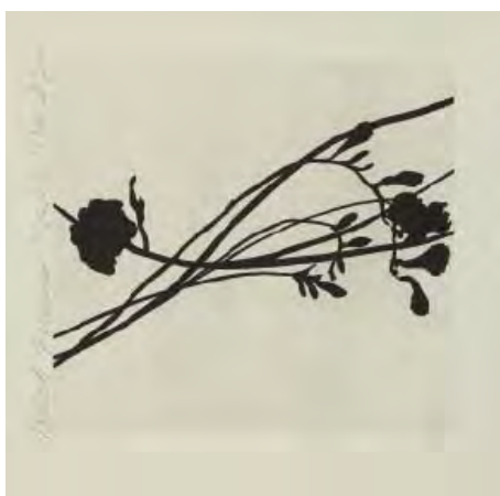
13- Donald Sultan, Black Freesia 3 , 1988 Aquatinte BnF, dépt. des Estampes et de la photographie © Donald Sultan / ADAGP Paris 2014