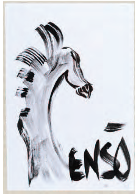
We were horses , 2011 Calligraphie de Carolyn Carlson BnF, Arts du spectacle, Fonds Carolyn Carlson