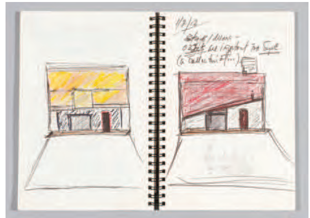
Synchronicity, 2012 Notes et croquis préparatoires de Carolyn Carlson