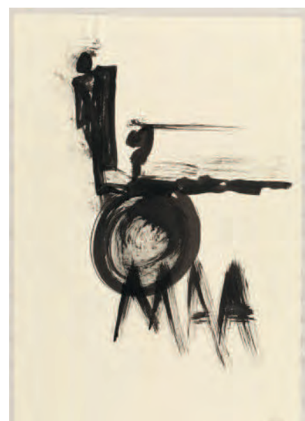
Maa , 1991 Calligraphie de Carolyn Carlson BnF, Arts du spectacle, Fonds Carolyn Carlson