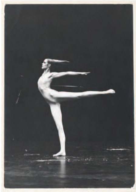
Carolyn Carlson dans Les Fous d'or, 1975.

Iconographie disponible dans le cadre de la promotion de l'exposition Carolyn Carlson, écriture et mouvement - à la BnF du 10 décembre 2013 au 26 janvier 2014 - et pendant la durée de celle-ci. Les images ne peuvent faire l'objet d'aucune retouche ni d'aucun recadrage.