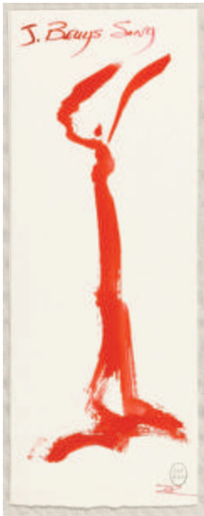
J. Beuys Song , 2001 Dessin de Carolyn Carlson, Carton utilisé lors des représentations de la pièce BnF, Arts du spectacle, Fonds Carolyn Carlson