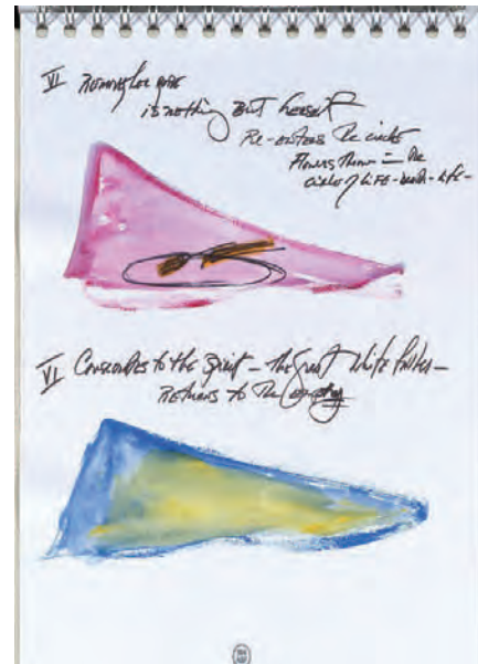
Inanna , 2005 Notes et croquis préparatoires de Carolyn Carlson BnF, Arts du spectacle, Fonds Carolyn Carlson