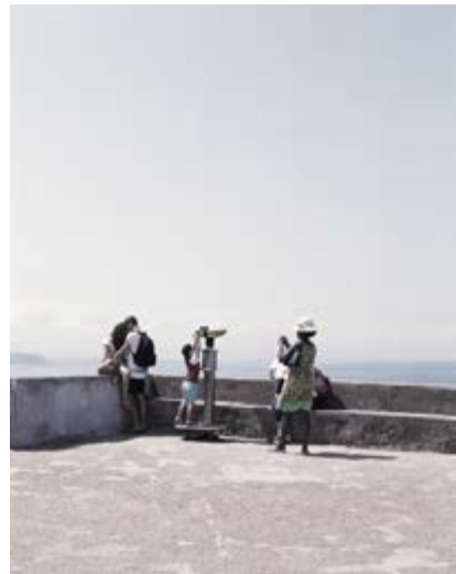
Mathieu Farcy Série « Paysages orientés », Point sublime - gorges du Verdon , 2014 © Mathieu Farcy, Courtesy agence Signatures