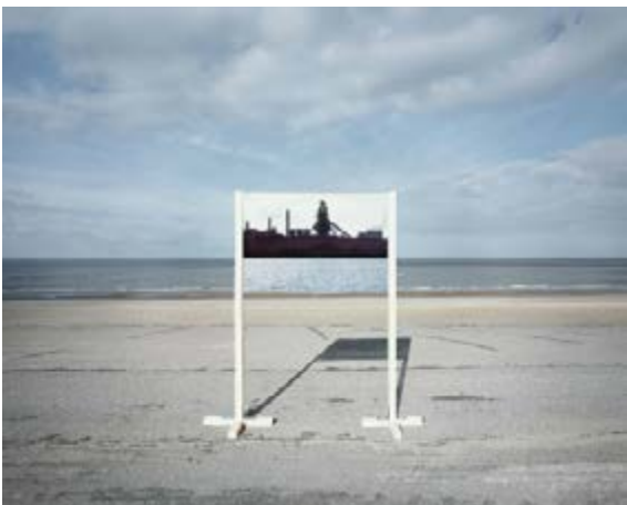
Guillaume Amat France(s) Territoire Liquide Série « Open fields », 2010