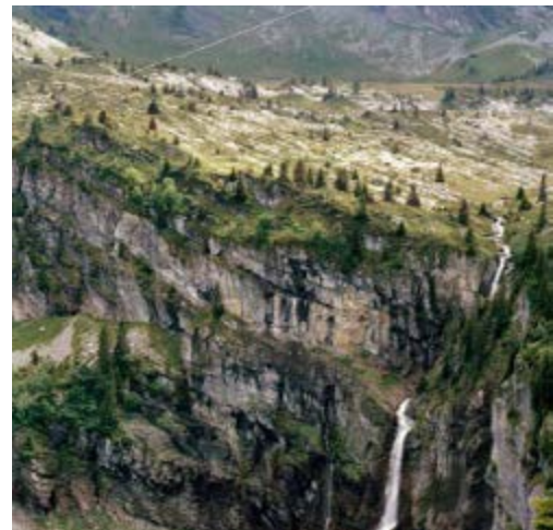
Emmanuelle Blanc France(s) territoire liquide Série « Cartographie d'une extrême occupation humaine » n° 6, altitude 1790, Le mont de Grange, Haute-Savoie massif du Chablais , 2011