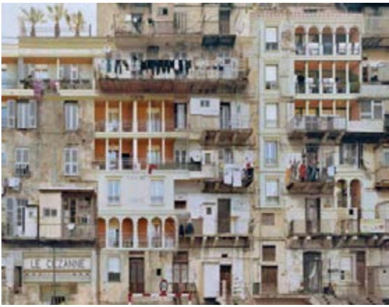
Stéphane Couturier Mission photographique du Centre méditerranéen de la photographie, commande « Sédimentations » Série « Melting Point », Bastia n°1 , 2007 © Stéphane Couturier- Courtesy La Galerie Particulière, Paris/Bruxelles Centre méditerranéen de la photographie, Bastia