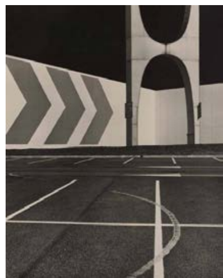
Albert Giordan Mission photographique de la DATAR Série « Espaces commerciaux », Montage photographique, 1984