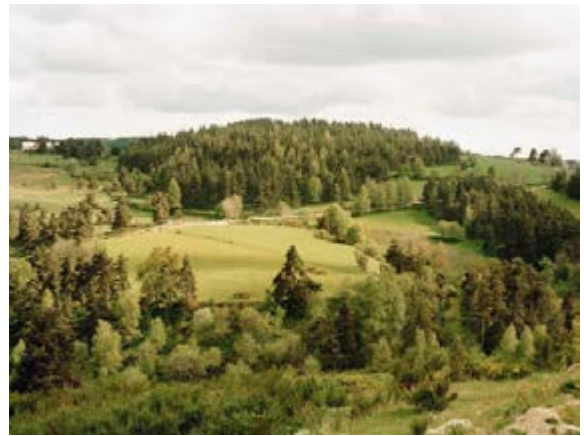
Thibaut Cuisset Série « Une campagne française » Sans titre (La Margeride, Lozère), 2010 Galerie Les Filles du Calvaire, Paris