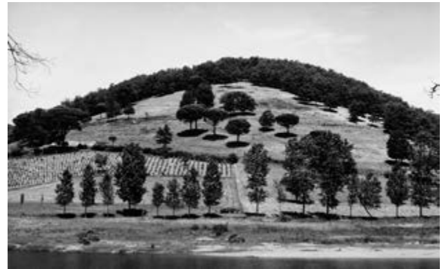
Pierre de Fenoÿl Mission photographique de la DATAR Série « Campagnes du Sud-Ouest » 10/07/87, 14 h, Tarn, 1987