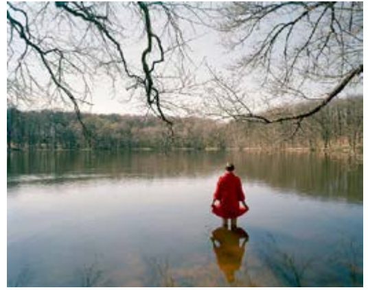
Elina Brotherus France(s) Territoire Liquide Série « 12 ans après », L'Étang 2012 Elina Brotherus © ADAGP, Paris 2017 Galerie Gb Agency, Paris. BnF, Estampes et photographie